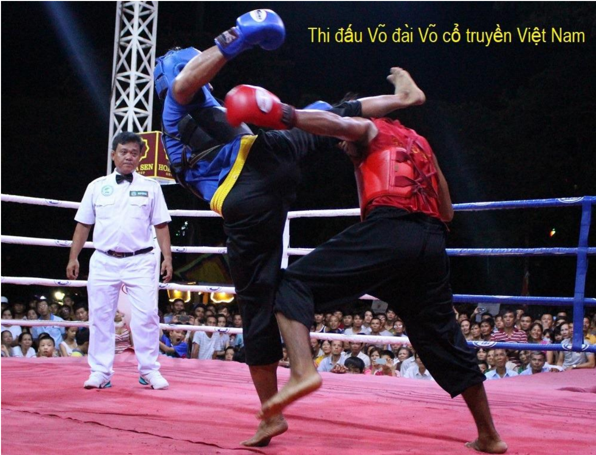
Thi đấu Võ đai Võ cổ truyền Việt Nam