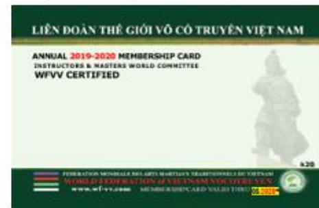
(verso) avec l'effigie de Quang Trung (Nguyễn Huệ)

(* les enseignants ne détenant pas encore de grade WFVV (et ne figurant donc pas encore au fichier mondial des enseignants WFVV) sont provisoirement enregistrés au fichier général des pratiquants d'arts martiaux vietnamiens.