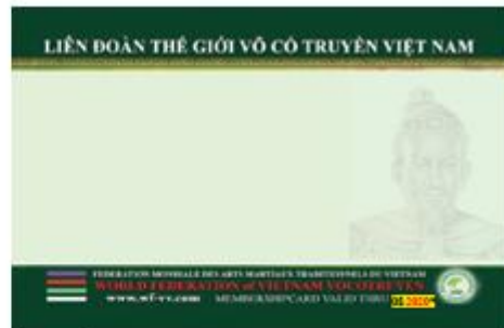
(verso) avec l'effigie de Trần Hưng Đạo (Trần Quốc Tuấn)

Les cartes destinées aux enseignants* détenteurs d'un grade WFVV (examen ou équivalence)