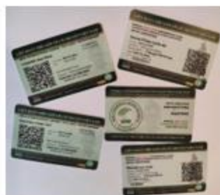
1 QR Code est présent sur chaque carte

Les cartes WFVV internationales sont valables pendant 1 saison (du 01 septembre au 31 août de l'année suivante). Les cartes 2019-2020, valides du 01/09/2019 au 31/08/2020, seront exigées pour toutes participations aux événements placés sous l'égide de la fédération mondiale WFVV (championnats, coupes, compétitions, examens et équivalences de grades, stages de formation et de perfectionnement, ...).