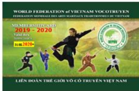
(recto) avec 5 personnages en action

Les cartes destinées à tous les pratiquants en général